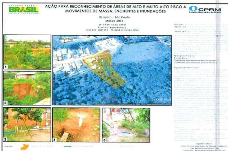
Figura 6 - Mapeamento de erosão - Bairro Barroca