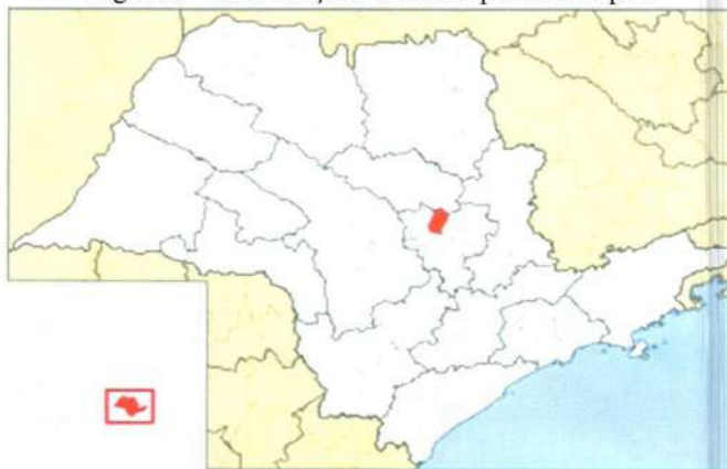
Figura 2 - Localização do município de Itirapina