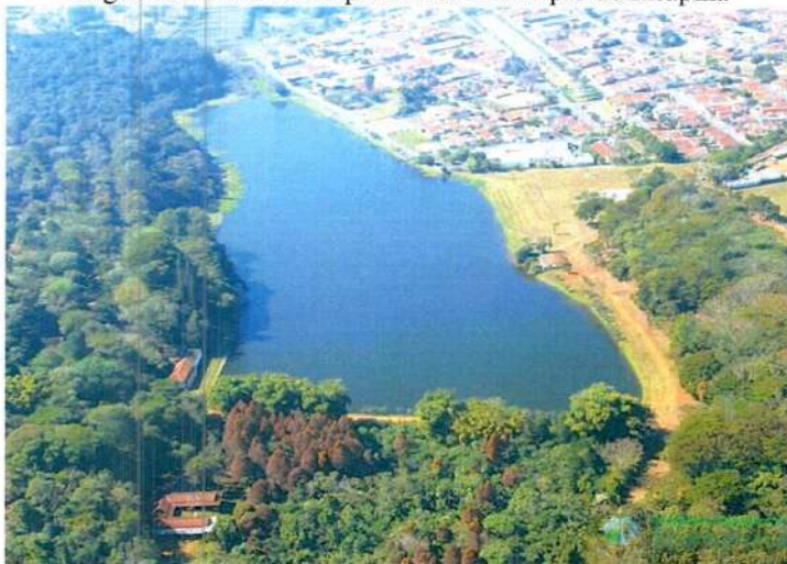
Figura 1 – Vista aérea parcial do município de Itirapina

Itirapina pertence à região turística da Serra do Itaqueri, sendo seus principais atrativos turísticos a Represa do Broa, Itaqueri da Serra, Estância de Ubá, Morro Pelado, Morro do Fogão e diversas cachoeiras.