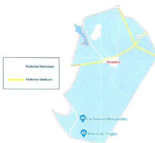
Figura 8 - Rodovias existentes no território municipal