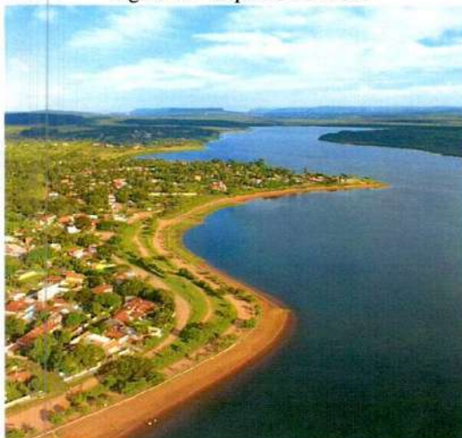
Figura 3 - Represa do Broa

A Represa do Broa, no Rio Lobo, está localizada no município de Itirapina. A bacia hidrográfica é originada pela captação artificial dos ribeirões Lobo e Itaqueri, e pelos córregos Geraldo e das Perdizes. A Represa do Broa possui aproximadamente 7,5 quilômetros de comprimento e serve como reservatório da Usina Hidrelétrica do Lobo.